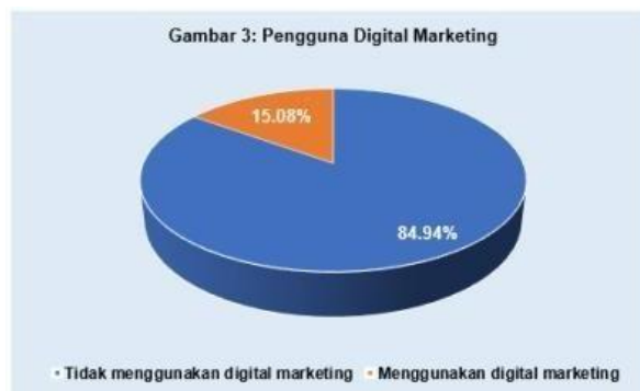
Gambar 3. Pengguna Digital Marketing

Merujuk pada temuan di atas, dapat disimpulkan bahwa usaha e-commerce yang ada di Indonesia masih tergolong sedikit. Banyak pelaku UMKM yang masih nyaman dengan penyelenggaraan usaha konvensional, padahal di era pandemi saat ini perlu adanya terobosan usaha di mana usaha konvensional dialihkan menjadi usaha daring. Usaha fashion seperti pakaian, jilbab, kemeja masih banyak diminati sebagai usaha online dengan presentase sebesar 22,11% padahal dengan pemanfaatan teknologi informasi ini, perusahaan mikro, kecilmaupun menengah dapat memasuki pasar global. (Sedyastuti, 2018).