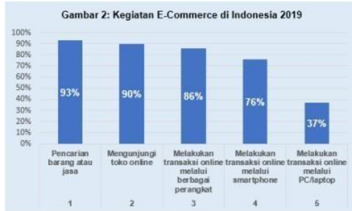
Gambar 2. Kegiatan E-Commerce di Indonesia 2019