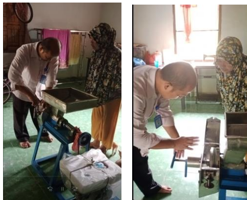
Gambar 3. Demonstrasi Penggunaan Mesin Penggiling Bahan Jamu

Setelah Pembuatan mesin penggiling bahan jamu selesai, Tim Pengabdian mengantar langsung alat Teknologi Tepat Guna (TTG) mesin penggiling bahan jamu ke lokasi mitra. Tim menjelaskan secara langsung cara kerja dan cara menggunakan mesin penggiling bahan jamu dengan melakukan demonstrasi penggunaan mesin penggiling bahan jamu dan cara perawatannya selama pemakaian.