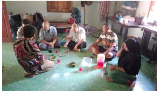
Gambar 1. Sosialisasi dan Observasi Kondisi Terkini Mitra

Pelaksanaan kegiatan selanjutnya adalah pembuatan mesin penggiling bahan jamu. Dalam Pembuatan mesin Penggiling bahan jamu tim pengabdian/ pelaksana berkordinasi dengan tim teknis di bengkel untuk proses pembuatan mesin penggiling bahan jamu. Tim terlebih dahulu menyediakan bahan yang diperlukan untuk Pembuatan mesin Penggiling bahan jamu. Setelah bahan yang diperlukan tersedia dilanjutkan dengan pengerjaan pembuatan mesin penggiling bahan jamu. Adapun spesifikasi dari Mesin Penggiling Bahan Jamu yaitu : Kapasitas Produksi 60 Kg per jam, Mesin Bensin 9 PK, Batu Gilingan 8 Inchi, Rangka kaki besi, dan material stainless steel.