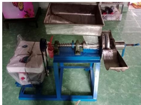
Gambar 2. Mesin Penggiling Bahan Jamu

Pelaksanaan kegiatan selanjutnya adalah pembuatan mesin penggiling bahan jamu. Dalam Pembuatan mesin Penggiling bahan jamu tim pengabdian/ pelaksana berkordinasi dengan tim teknis di bengkel untuk proses pembuatan mesin penggiling bahan jamu. Tim terlebih dahulu menyediakan bahan yang diperlukan untuk Pembuatan mesin Penggiling bahan jamu. Setelah bahan yang diperlukan tersedia dilanjutkan dengan pengerjaan pembuatan mesin penggiling bahan jamu. Adapun spesifikasi dari Mesin Penggiling Bahan Jamu yaitu : Kapasitas Produksi 60 Kg per jam, Mesin Bensin 9 PK, Batu Gilingan 8 Inchi, Rangka kaki besi, dan material stainless steel.