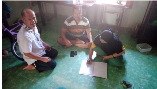
Gambar 4. Penandatanganan Berita Acara Serah Terima TTG

Pelaksanaan kegiatan berikutnya adalah Seremonial Penyerahan TTG Mesin Penggiling bahan jamu kepada mitra dan dilanjutkan dengan penandatanganan berita acara serah terima alat dari Ketua Program kepada Mitra.