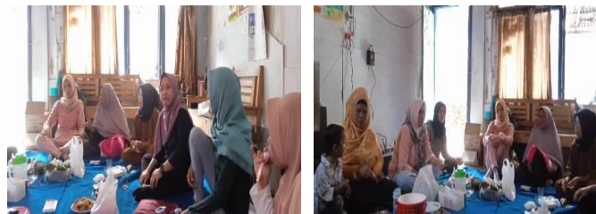
Gambar 1. Pelaksanaan Kegiatan

Kegiatan dilaksanakan pada Bulan Mei 2024, dengan peserta dari Paguyuban Wali murid SDN 3 Purwanegara. Bertempat di rumah salah satu anggota Paguyuban, dan respon terhadap kegiatan ini cukup tinggi dengan melihat bagaimana antusias dari peserta karena kekhawatiran mereka terhadap teknologi yang sangat mudah diakses oleh anak.